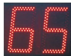
Digit mit 250 mm Ziffernhöhe